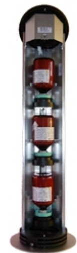
7. Ventilator- geschwindigkeit Vitesse du ventilation